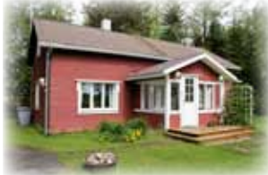
Vähälän torppa Paltaniemellä oli 1800 -luvulla torppia ja pieniä mökkejä, joita myöhemmin laajennettiin. Kun vehnäpulla tuli Paltaniemelle, ruvettiin pitämään pirttikahviloita. Vähälän torpassa on päivien aikan tutustumismahdollisuus sekä myynnissä käsityötuotteita ja pirttikahvila. Pappilanniementie 198.

Paltaniemen tallilla voi ratsastaa Raisu -ponilla. Raisu -ponin kaveri Minttu on jo niin vanha, ettei sillä enää ratsasteta. Talli on auki Paltaniemi -päivillä auki joka päivä klo 10.00-14.00 osoitteessa Hövelöntie 98.