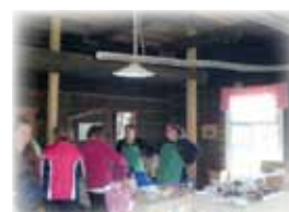
Immolan pirtissä myyjäiset