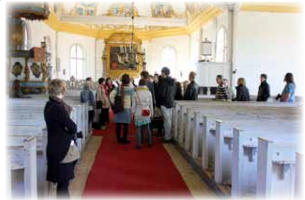
Kajaanin matkailuoppaat järjestävät opastuskierroksen kuvakirkkoon ja vainajien varvikkoon joka päivä klo 12.00 ja 14.00.