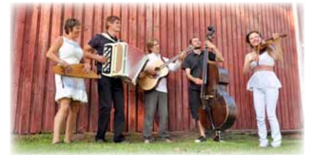
Kansanmusiikkiyhtye Burlakat Joensuusta esiintyy Paltaniemen kuvakirkossa lauantaina 14.7. klo 19.00.