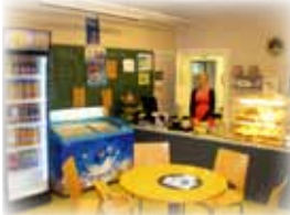
Cafe Paltaniemi Paltaniemen kyläyhdistyksen ylläpitämä Cafe Paltaniemi palvelee Paltaniemi -päivien aikaan kahvilasta saa myös ruokaa.